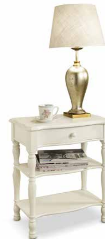
Com07 Comodino con cassetto e gambe tornite Chest with drawer and turned legs cm. 56 x 46 x 63 h.