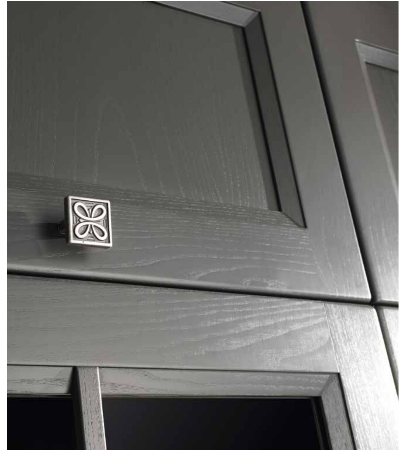
La qualità nei dettagli... Quality lies in details...