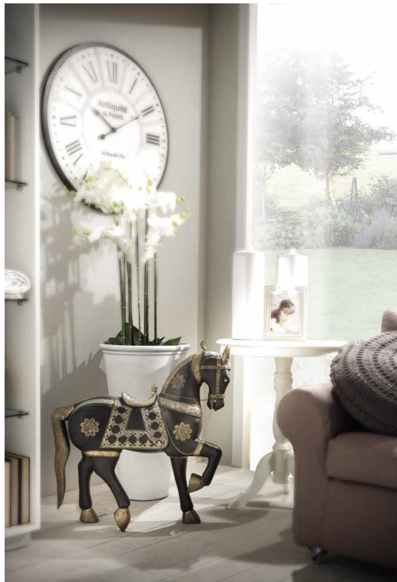
Armoniose combinazioni estetiche Harmonious esthetical combinations