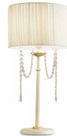
III02 Lampada da tavolo con strass Paralume plissettato beige Table lamp with strass Beige plissé lampshade