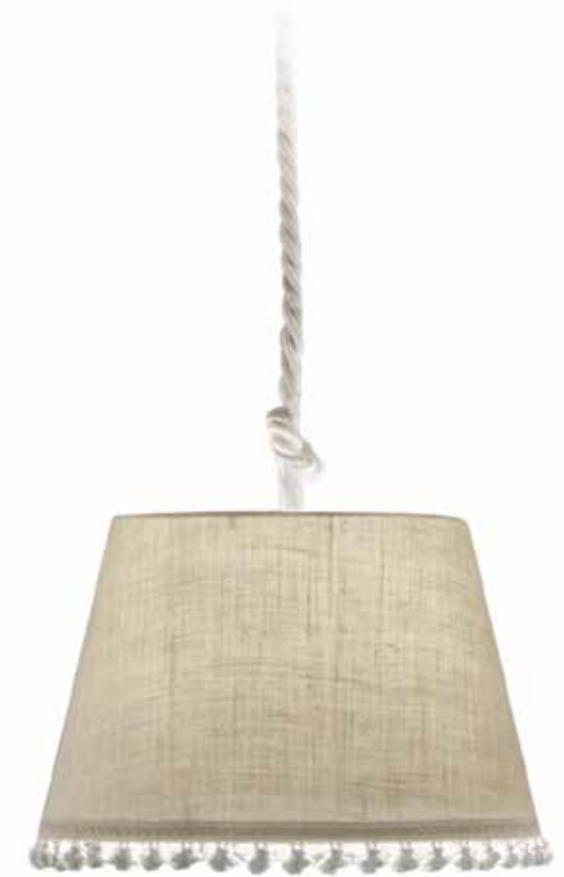
III05 Sospensione in stoffa e corda Paralume cm. Ø 50 color corda grezza con peneri Fabric and cord pendant lamp cm. ø 50 colour: rough cord with lampshades