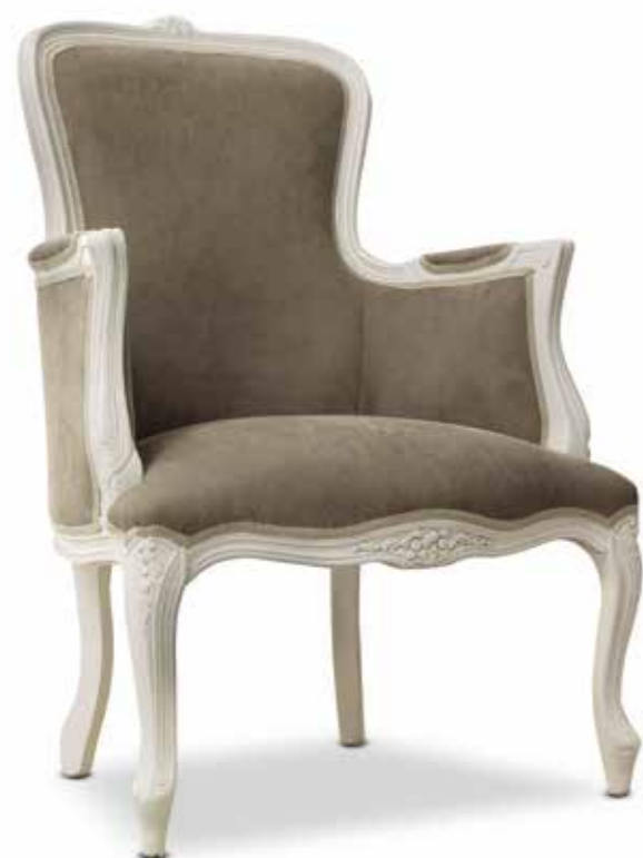
Sed43 Balzac Poltrona imbottita Upholstered armchair