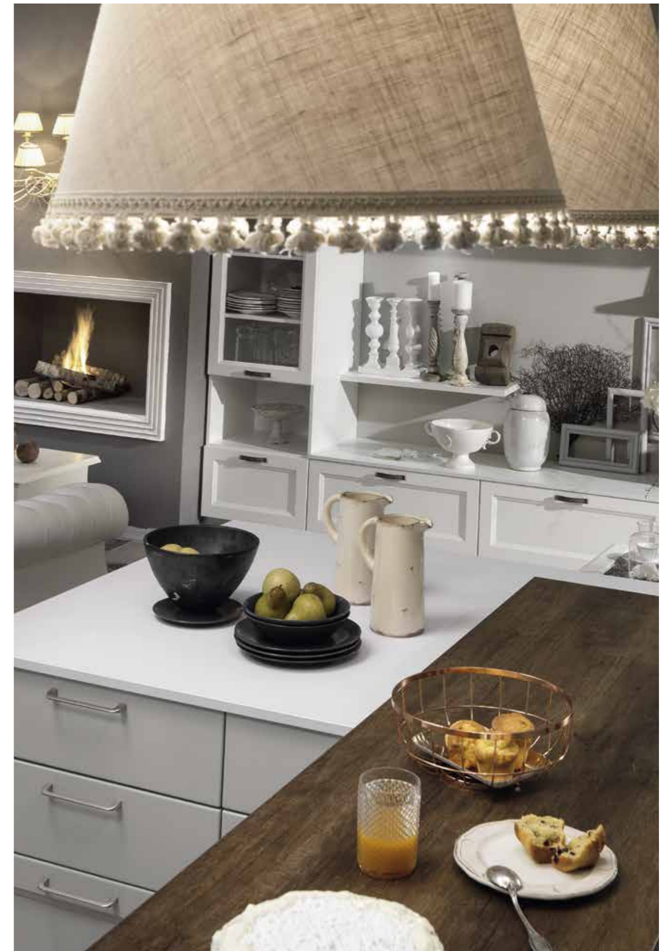
Diversità dei materiali per ogni funzione Different materials for each function