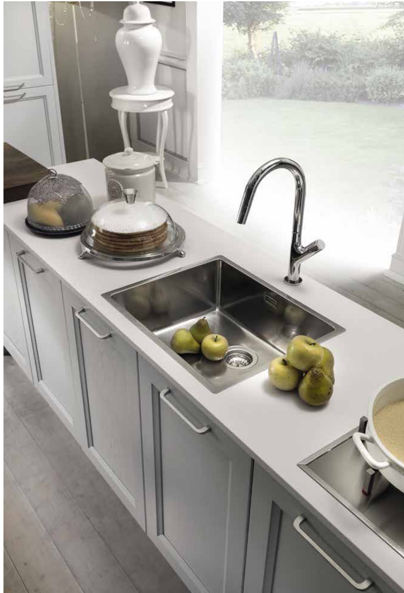
Dalla tradizione alla tecnologia... From tradition to technology...