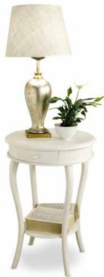
Com08 Tavolino rotondo con cassetto Round coffee table with drawer cm. ø. 50 x 74 h.