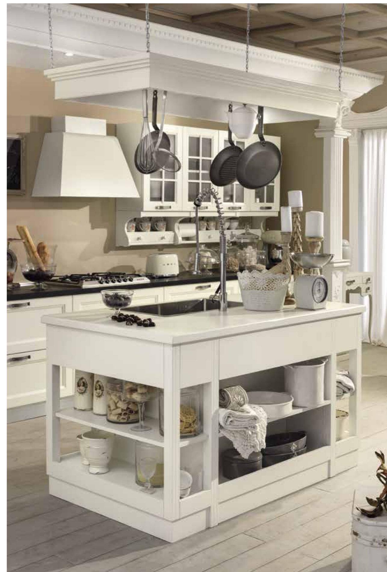
L'isola centrale, caratterizza questa nostra proposta per uno spazio operativo pratico e funzionale. The central island portrays our proposal by offering a practical and functional operative environment.