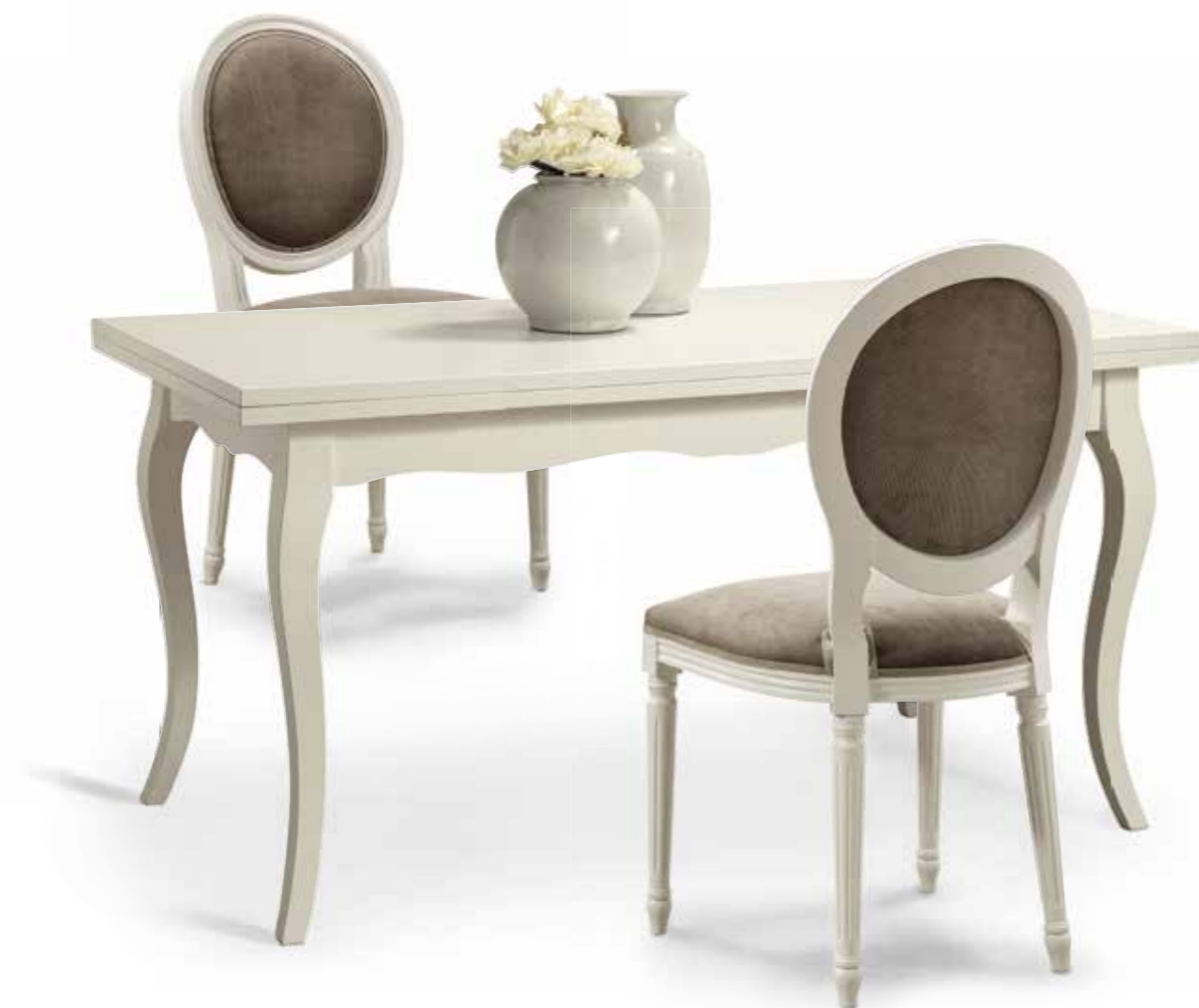
Tav23 Tavolo rettangolare laccato Gambe a sciabola Lacquered rectangular table Tapered and flared legs Cm.160 x 85