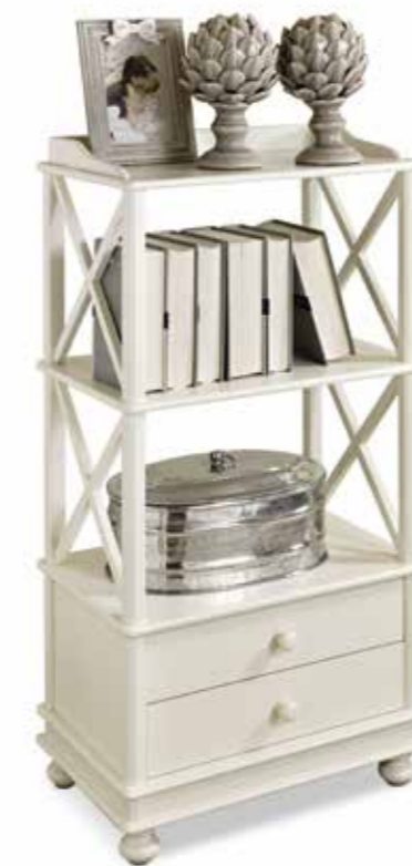
Com05 Étagère Étagère cm. 54 x 34 x 105 h.