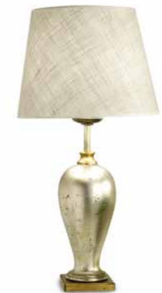
III03 Lampada da tavolo basamento legno e paralume in stoffa corda grezza. Table lamp with wooden base and rough cord lampshade