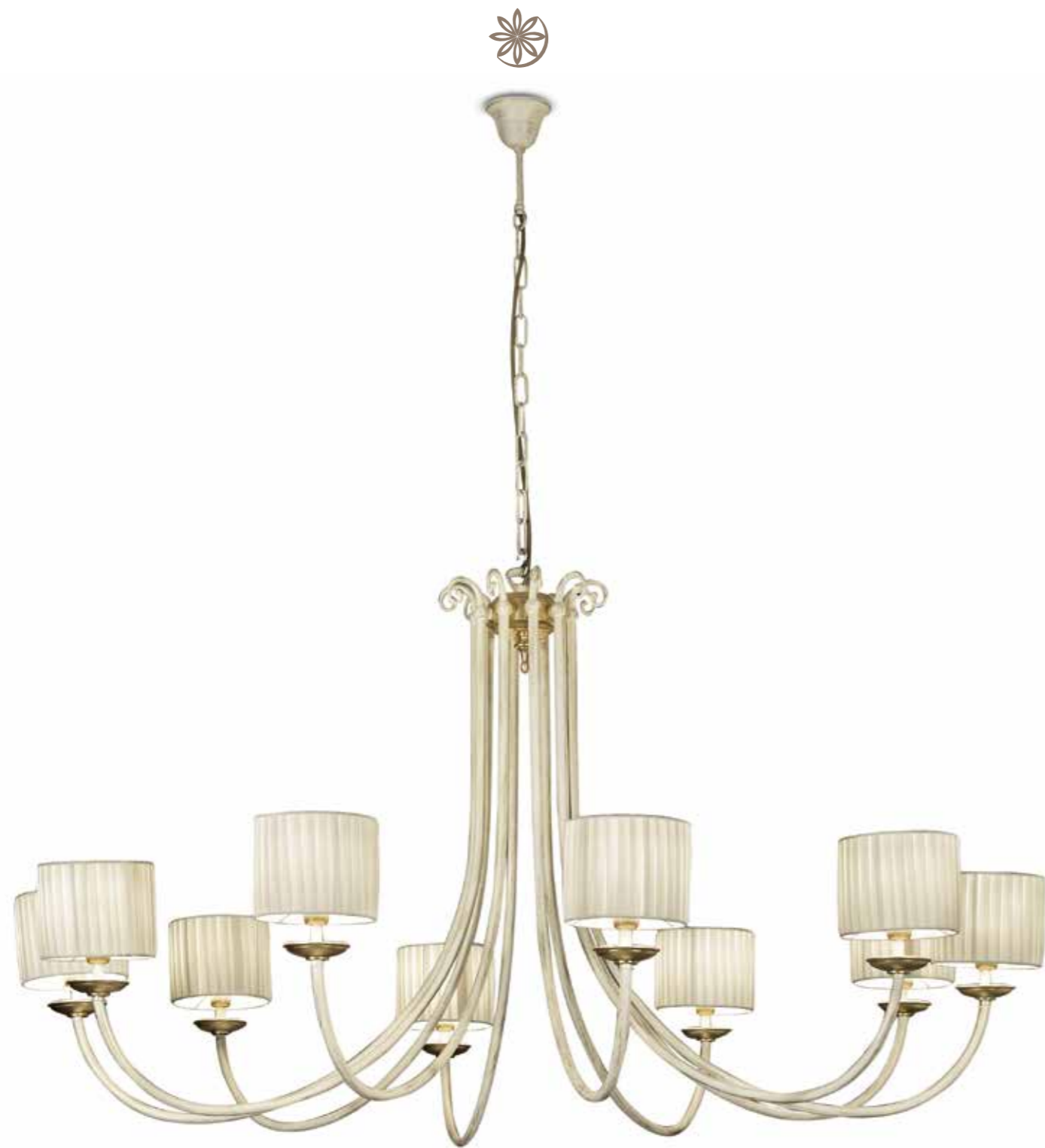
III04 Lampadario 10 luci cm. Ø 120 Paralumi plissettati 10-light chandelier cm. ø 120 Plissé lampshades