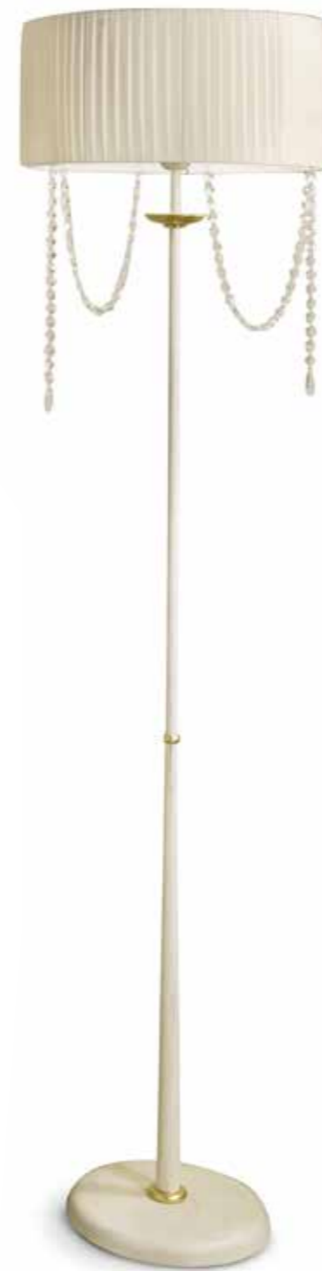
III01 Lampada da terra con strass paralume plissettato beige Floor lamp with strass Beige plissé lampshade