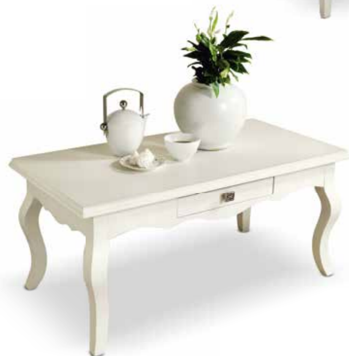
Com09 Tavolino rettangolare con cassetto Rectangular coffee table with drawer cm. 100 x 50 x 45 h.