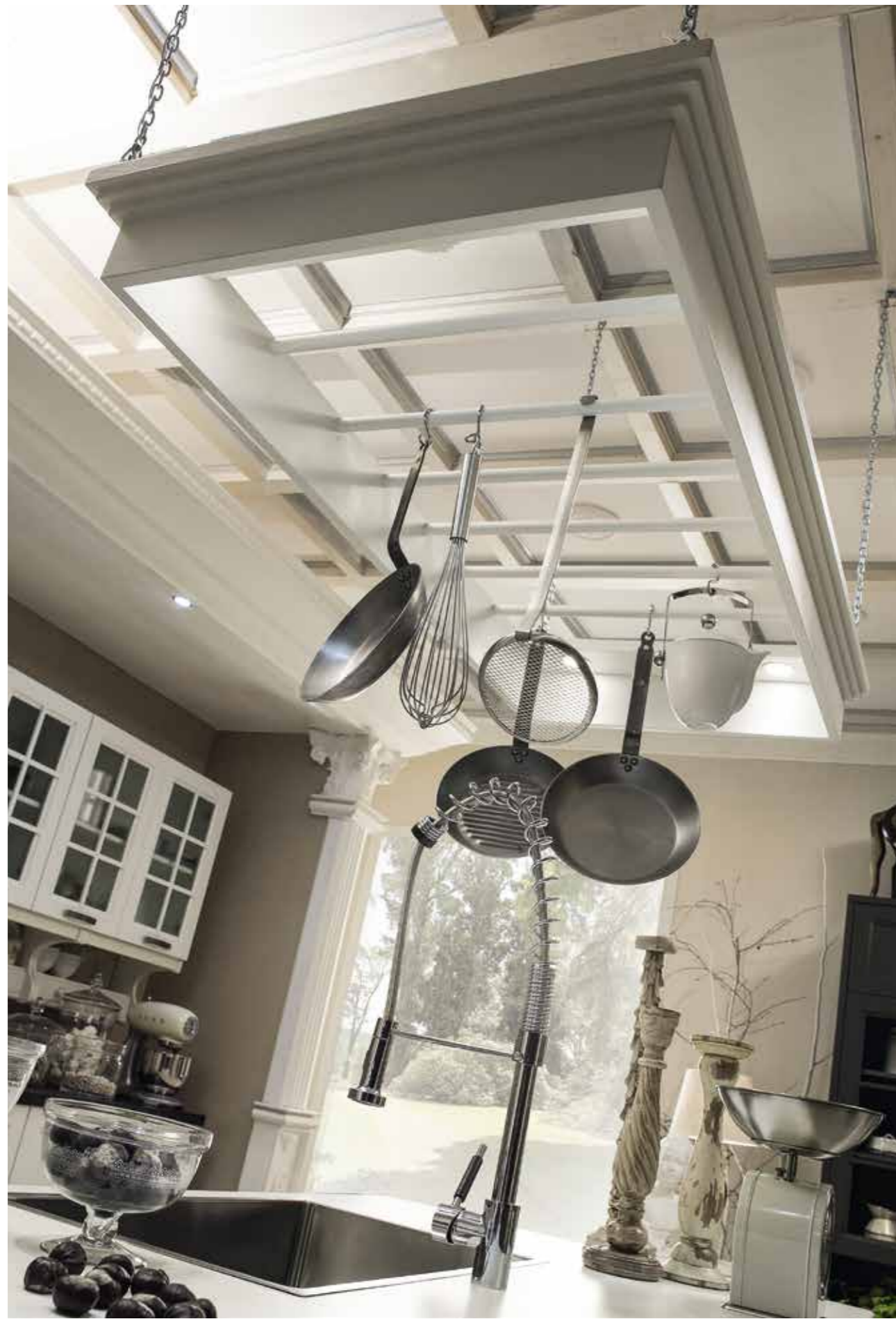
Scene di vita nate dalla memoria Life scenes born by memories