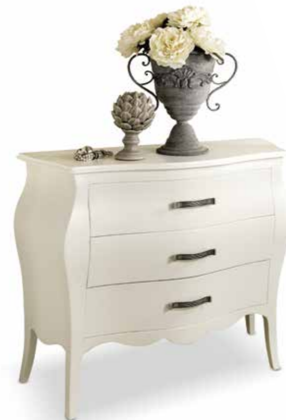
Com04 Comò tre cassetti 3-drawer chest cm. 100 x 42 x 85 h.