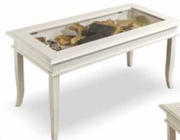
Com02 Bacheca rettangolare con vetro Rectangular coffee table with glass cm. 100 x 50 x 45 h.