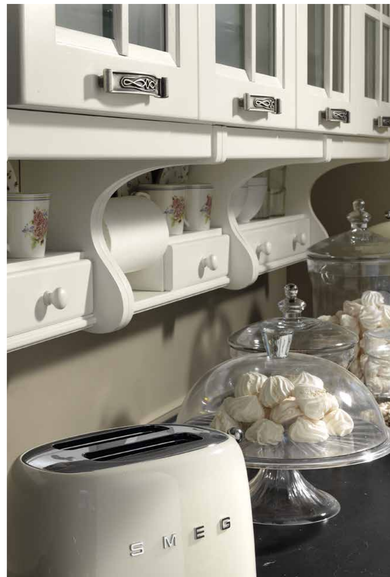
L'aggiunta di piccoli, importanti particolari personalizza l'ambiente e lo rende unico Few but important details customize the environment and make it unique