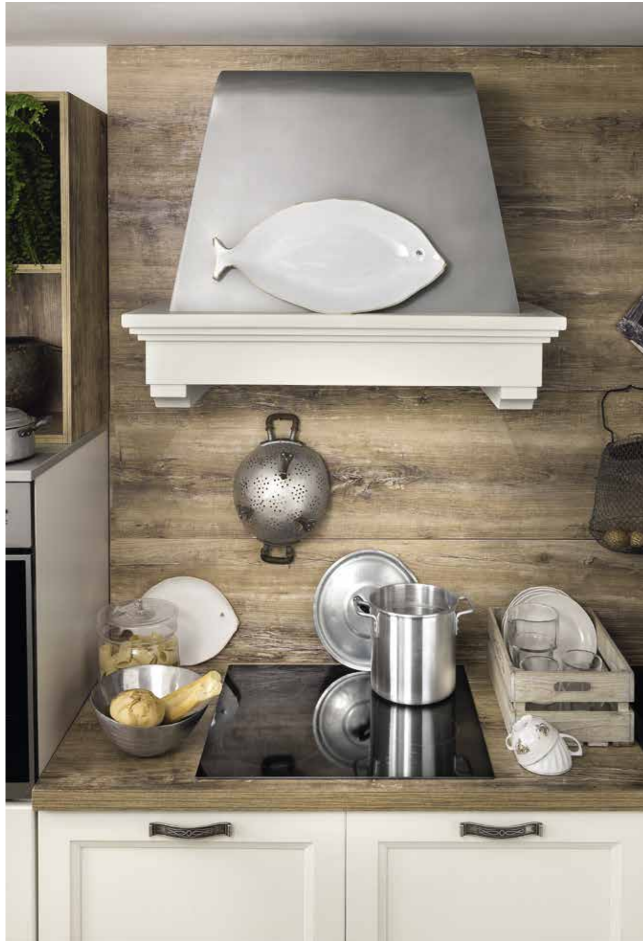
Sensazioni di grande armonia Great harmony sensations