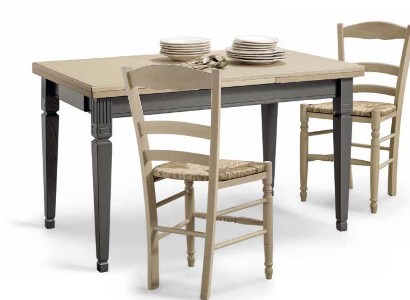
Tav35 Tavolo rettangolare in frassino allungabile, con cassetto Laccato bicolore gambe a piramide intarsiate Extendable rectangular table in ash wood, with drawer Two-colour-lacquered Inlaid pyramidal legs cm.140 x 80