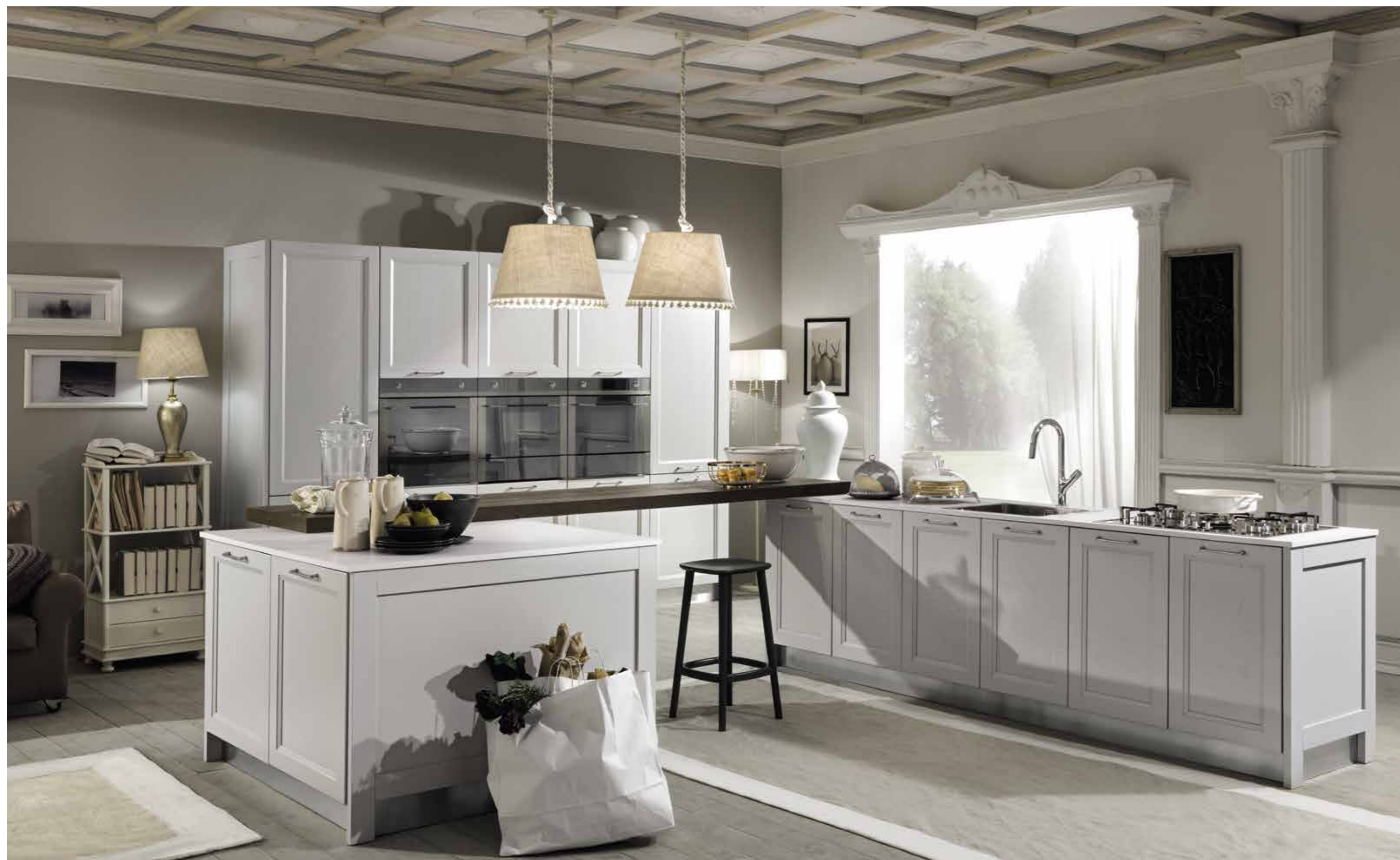
La bellezza dell'ambiente è esaltata dalle composizioni della cucina e del soggiorno The beauty of the environment is stressed by kitchen and living room