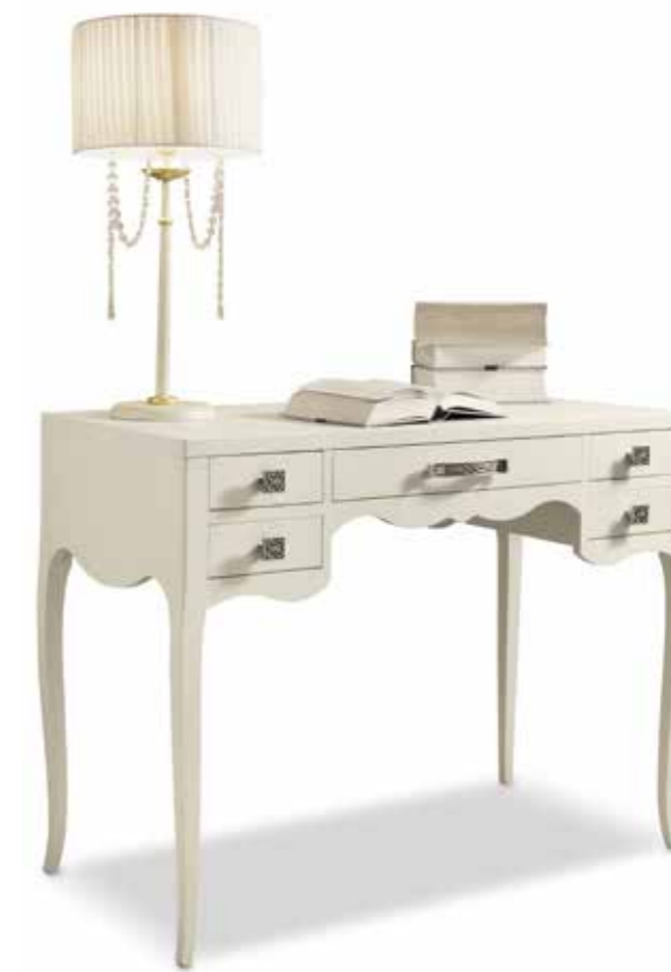
Com066 Scrivania 5 cassetti 5-drawer desk cm. 102 x 50 x 80 h.