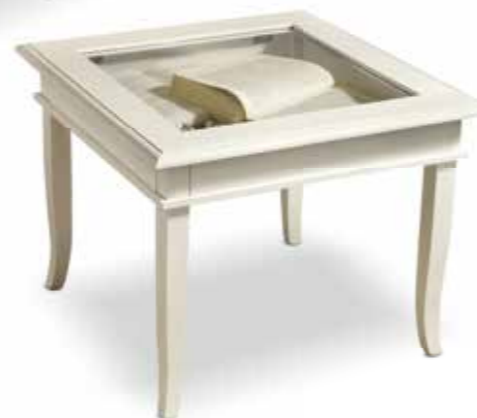
Com03 Bacheca quadrata con vetro Square coffee table with glass cm. 60 x 60 x 45 h.