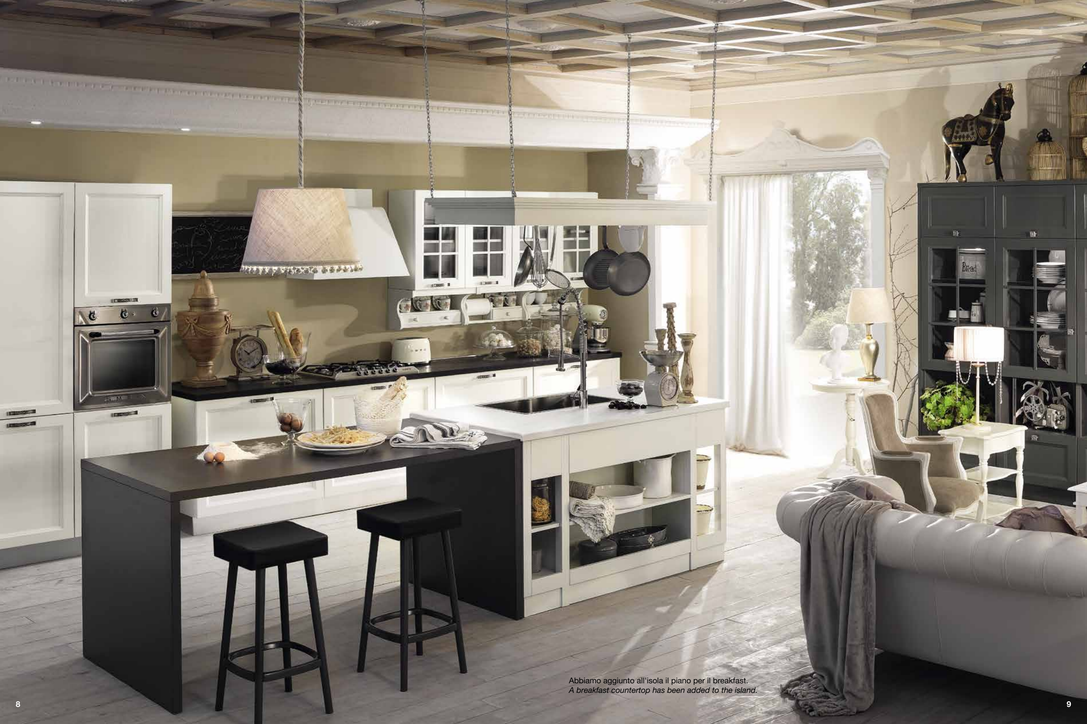
Abbiamo aggiunto all'isola il piano per il breakfast. A breakfast countertop has been added to the island.