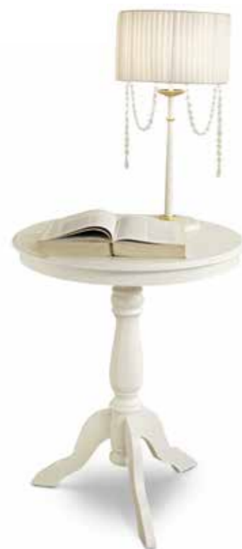
Com01 Tavolino rotondo Round coffee table cm. ø 60 x 75 h.