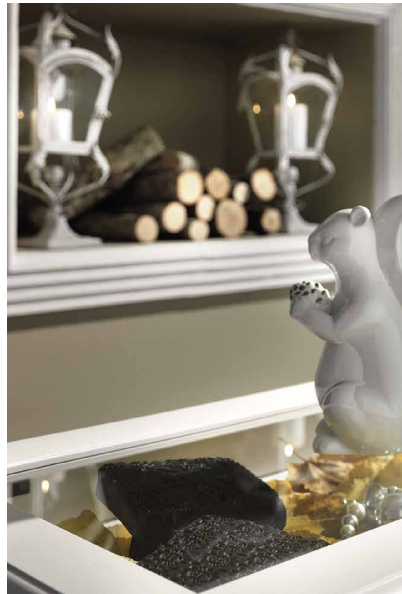
Scelte che ci fanno "sentire a casa" Choices that make us to "feel at home"