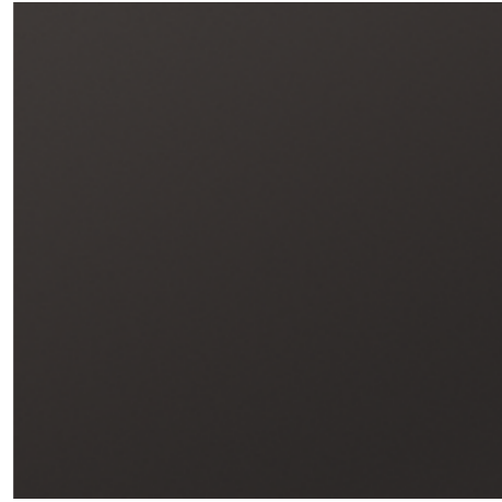
2 Nobilitato antracite grafite finitura topmatt Graphite anthracite Topmatt finishing