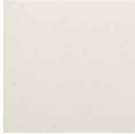
1 Nobilitato bianco finitura cera White natural Wax finishing