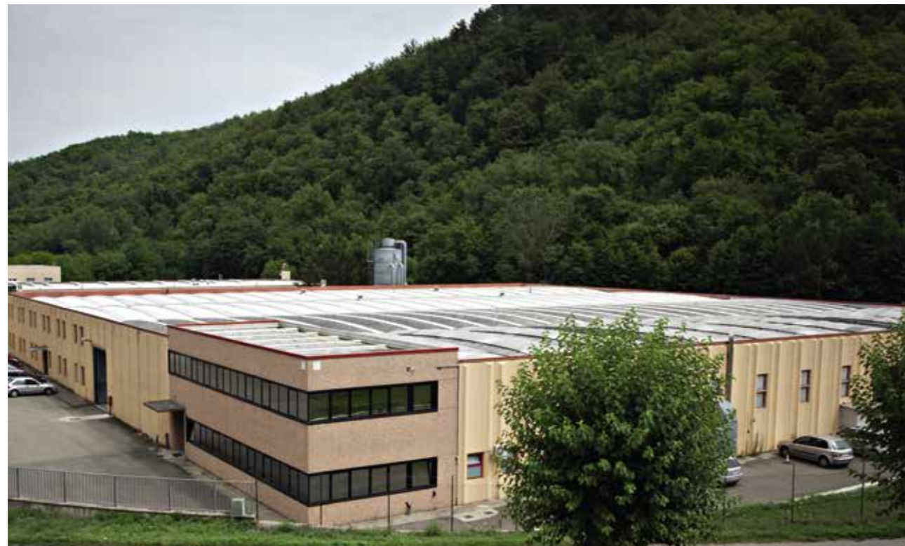
Giannini Cucine: 50 anni di qualità, bellezza e praticità. Questa è la nostra garanzia! Giannini Cucine: 50 years of quality, beauty and practicality. This is our warranty!