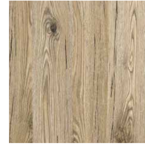
Oasi da pag. 38 a pag. 49 8 Nobilitato Quercia nodato Knotted oak