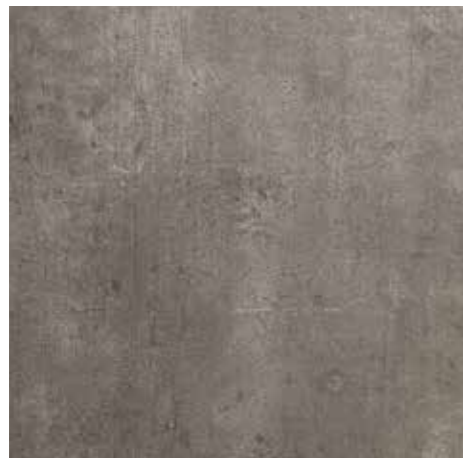
Oasi da pag. 4 a pag. 14 1 Nobilitato Ossido nero Lentini TM3 Black oxide "Lentini TM3"