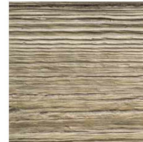
Oasi da pag. 50 a pag. 61 11 Anta in rovere massello di recupero spazzolato e stuccato con resine naturali Recycled oak, brushed and stuccoed with natural resins