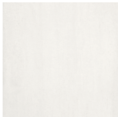
Oasi da pag. 26 a pag. 37 5 Nobilitato Texstone Bianco A10 White texstone A10