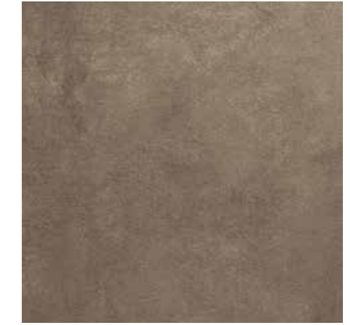
Oasi da pag. 26 a pag. 37 9 Nobilitato Kena bronzo DN6 Bronze Kena DN6