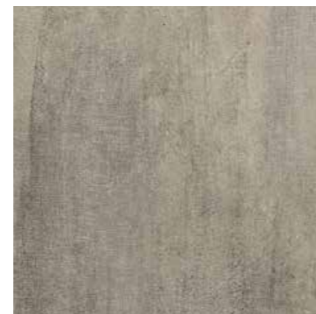
Oasi da pag. 16 a pag. 25 6 Nobilitato Texstone grigio A11 Grey texstone A11

Su richiesta possiamo fornire fianchi di finitura strutturali del medesimo colore delle ante. Upon customer's request, we can provide structural finish hips of the same colour as the doors.