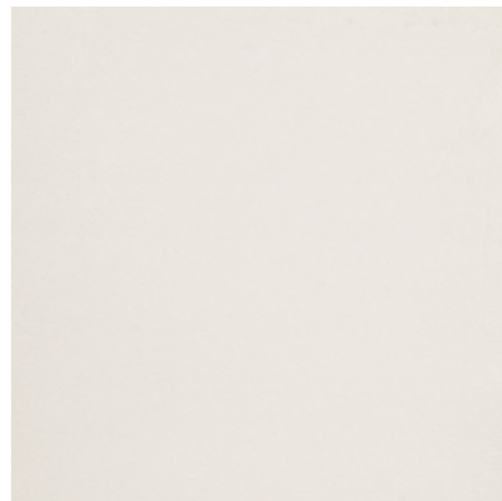
Oasi da pag. 4 a pag. 14 2 Nobilitato Ossido Bianco OSS White oxide OSS