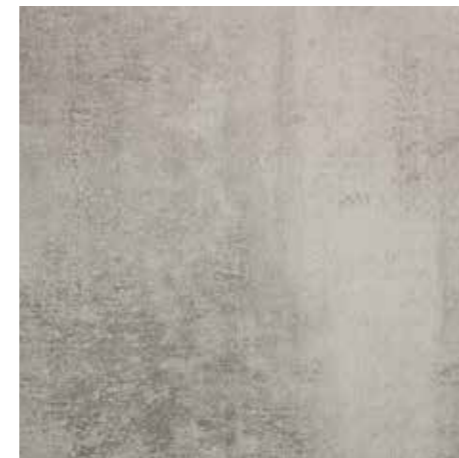
Oasi da pag. 38 a pag. 49 3 Nobilitato Ossido Grigio DA4 Grey oxide DA4