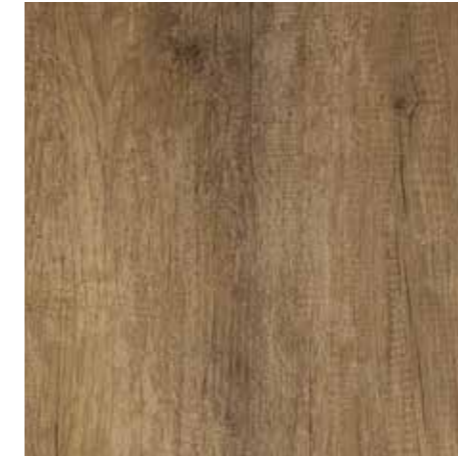
Oasi da pag. 16 a pag. 25 7 Nobilitato Rovere Nodato 988 Knotted oak 988