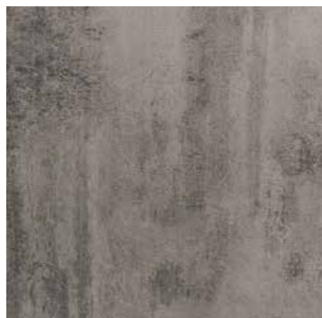
Oasi da pag. 50 a pag. 61 4 Nobilitato Ossido Grigio DU9 Grey oxide DU9